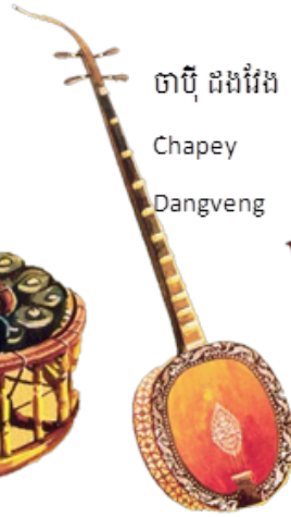
ចាប៊ី ដងវែង Chapey Dangveng