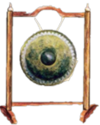
គង ធំ Korng Thom