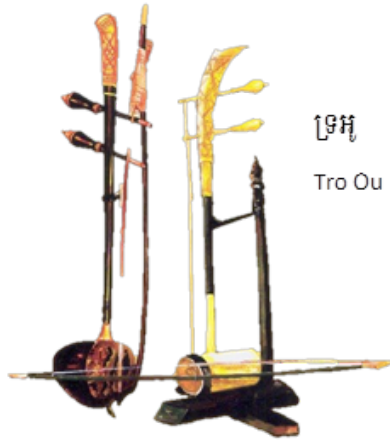
ទ្រូអូ Tro Ou