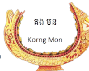
គង មន Korng Mon