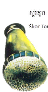
ស្ករតូច Skor Touch