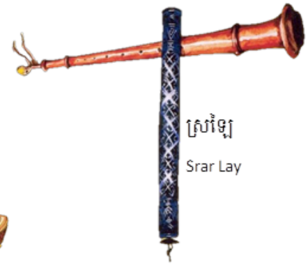
ស្រែវឡៃ Srar Lay